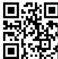
Figur 1 QR koden går till anmälningsformuläret